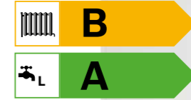
Condens 2000 W Yoğuşmalı Hermetik Kombi